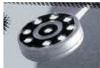
Wenn es zu regnen beginnt, reagiert er sofort: Der Regensensor für wetterunabhängigen Sonnendachgenuss.