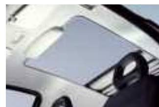
Das Hollandia 400 bietet Ihnen einen herrlichen Ausblick.