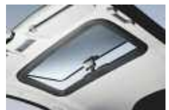
Durch das eindringende Licht wirkt der Fahrzeuginnenraum größer, heller und freundlicher.