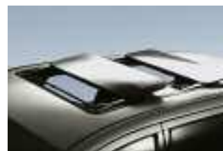
Flott und elegant zugleich: Das Elegance mit zwei beweglichen Paneelen vorne und hinten.