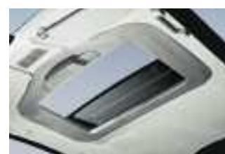
Durch den attraktiven Rahmen und das optionale Sonnenrollo ist das Dach auch von innen ein Hingucker.