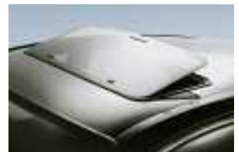
Herrlicher Frischluftgenuss: Mit der Ausstell-Öffnung des Hollandia 100 zirkuliert die Luft im Innenraum optimal.