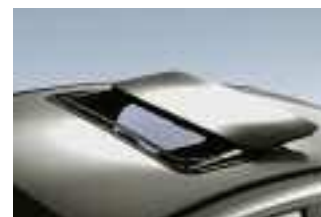
Das Hebe-Schiebedach – hier mit Teleskop-Mechanik – macht das Hollandia 300 zum idealen, flexiblen Dach für alle Autotypen.