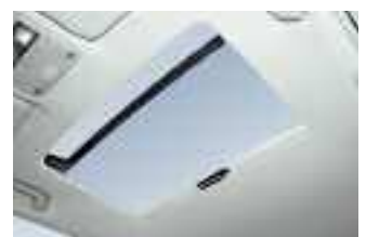
Mit der großen Dachöffnung erleben Sie ein Gefühl wie unter freiem Himmel.

Design-Typ/Funktionsprinzip: Integriertes Hebe-/Schiebedach