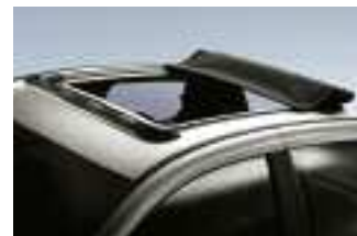
Ein echtes "Open-Air-Erlebnis": Die riesige Dachöffnung des Hollandia 400.