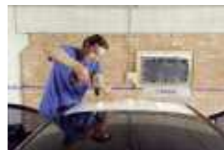
Zertifizierte Webasto Partner führen den Einbau Ihres Dachsystems kompetent und fachmännisch durch.