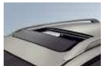
Der übergroße Windabweiser sorgt für ungestörten Fahrgenuss.