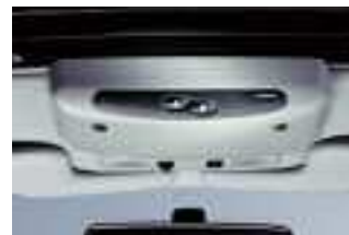
Bedienen Sie Ihr Webasto Dachsystem schnell und einfach mit einer leichten Berührung.