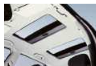
Mit dem Hollandia 500 genießen neben Fahrer und Beifahrer auch die Passagiere im Fond mehr Licht und frische Luft.