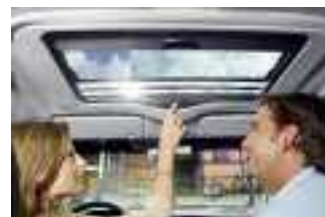
Auch nach dem Einbau ist Ihr Webasto Partner jederzeit mit Rat und Tat für Sie da.